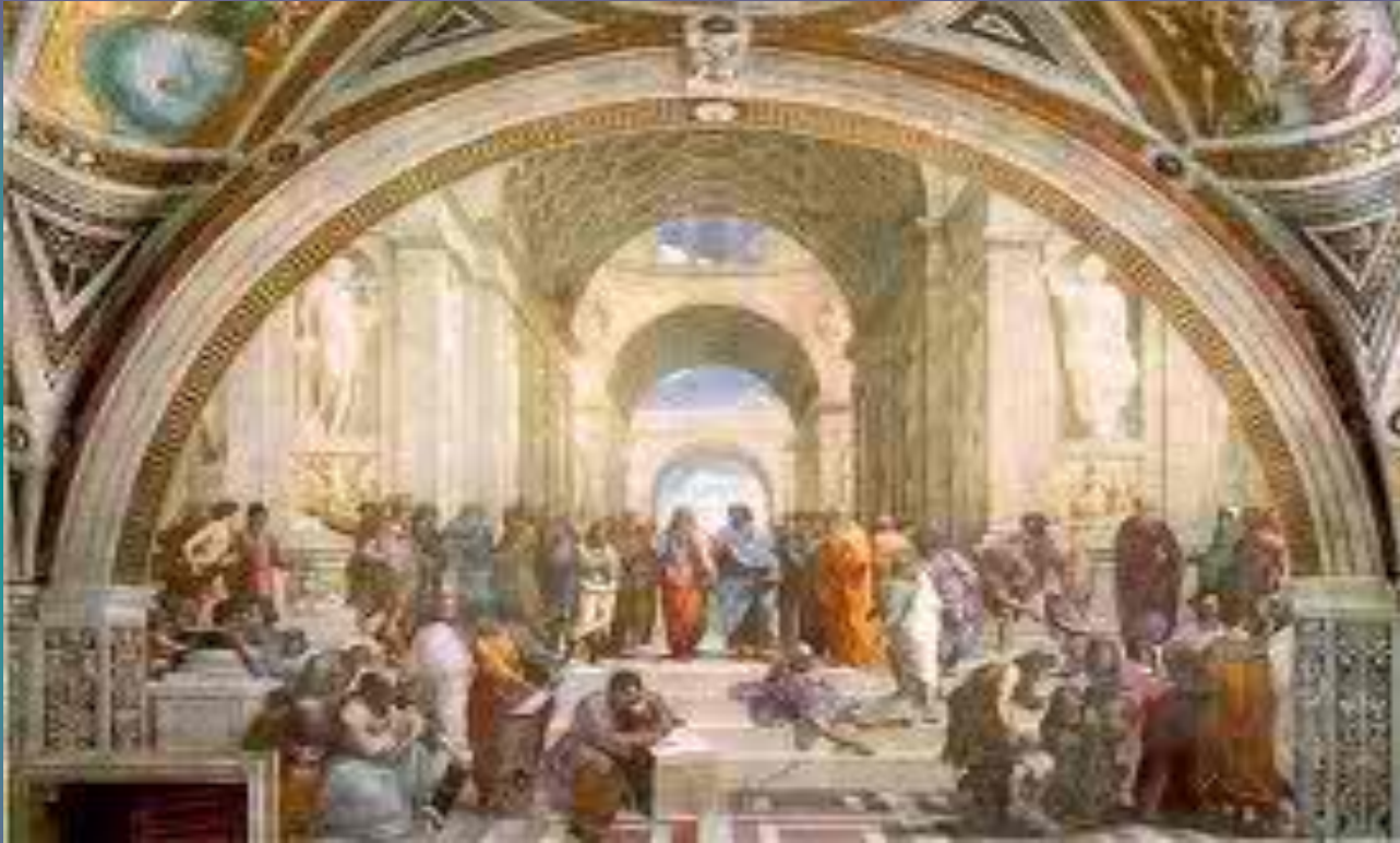
Η αρχαία Αγορά των Αθηναίων