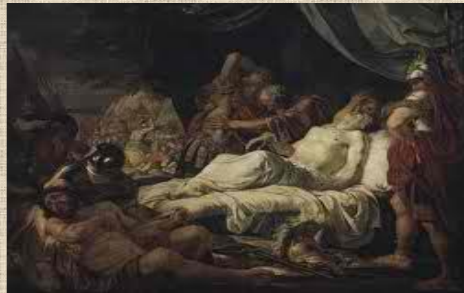
Ο θάνατος του Πελοπίδα