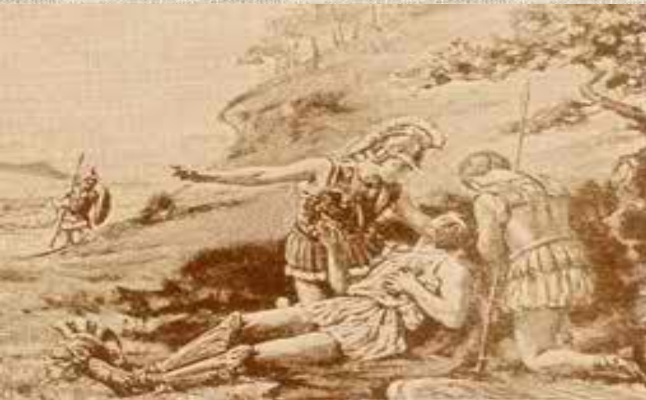
Ο θάνατος του Επαμεινώνδα